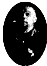
Paolo Nori è nato a Parma nel 1963

Tutte le classi disciplinate sono simili fra loro, ogni classe indisciplinata è indisciplinata a modo suo. Tutto era in scompiglio nella prima A commercio estero dell'Istituto Tecnico Commerciale Macedonio Melloni. La professoressa di geografia aveva saputo che il bidello intratteneva una relazione con la professoressa di francese che aveva avuto la supplenza nella loro classe, e aveva dichiarato al bidello di non poter più vivere nella stessa scuola con lui. Questa situazione durava già da più di due giorni ed era avvertita in modo doloroso dai professori e dagli alunni, nonché da tutto il personale non docente. Tutti i membri del corpo insegnante e il personale non docente sentivano che la loro convivenza non aveva più