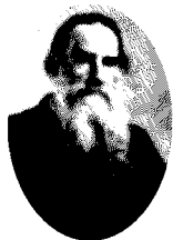
Lev Tolstoj (1828-1910)

Tutte le famiglie felici sono simili fra loro, ogni famiglia infelice è infelice a modo suo. Tutto era in scompiglio in casa Oblonskij. La moglie aveva saputo che il marito intratteneva una relazione con la governante francese che era stata in casa loro, e aveva dichiarato al marito di non poter più vivere nella stessa casa con lui. Questa situazione durava già da più di due giorni ed era avvertita in modo doloroso dai coniugi e da tutti i membri della famiglia, nonché dai domestici. Tutti i membri della famiglia e i domestici sentivano che la loro convivenza non aveva più senso e che persone riunite dal caso in una locanda