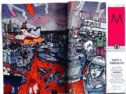
Dopo il terremoto CONTINUA DA PAG. 101

In quanto più viscerale e legata ai bisogni primari, la pulsione è associata alla ripetizione e alla regressione: non sarà la ricerca dell'oggetto del desiderio (impossibile) a colmare il vuoto, ma una specie di messa in atto della perdita stessa. Dean analizza la nostra partecipazione nelle attività digi-culturali in sconfortanti e antiutopici termini di cattura e di intrapolamento dell'energia umana.