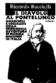
Il diavolo al Pontelungo 2001, Milano Mondadori 430 pagine, 9 euro