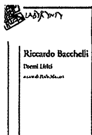
Poemi lirici 2010, Lanciano Carabba 18 euro, 210 pagine