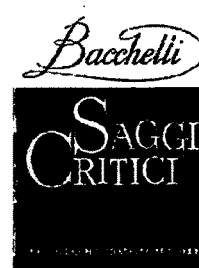
Saggi critici 1962, Milano Mondadori (fuori catalogo)