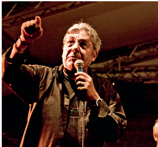
Il maestro Franco Micalizzi

C hi non ricorda la mitica sigla di un cartone animato come Lupin oppure il tema del film Lo chiamavano Trinità . Musiche ormai entrate nell'immaginario popolare e che ancora oggi ottengono grande successo. Tante note, emozioni e atmosfere di una stagione formidabile per il cinema italiano sono quelle che si trovano tra le tracce di Golden '70 , la nuova raccolta con il meglio di Franco Micalizzi. Accompagnato dalla The light symphony orchestra, il maestro ripercorre la sua carriera circondato dai tanti amici incontrati durante la carriera. Micalizzi è stato la colonna sonora di un cinema, quello definito "a mano armata", ha creato un genere a suon di funky ma con questo nuovo lavoro ci fa scoprire il lato più spensierato, le musiche delle tante